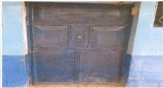
Foto1: Puertas en mal estado, despintadas