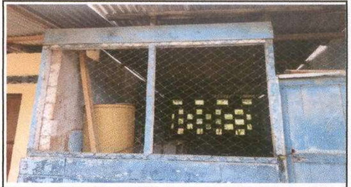
Foto 2: Ventanales de la cocina con estructura de madera y malla en mal estado y puerta sin condiciones adecuadas para cocinar.