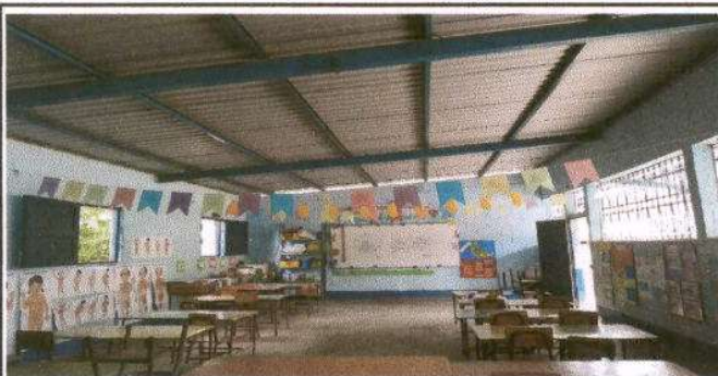
Foto: falta un división en el aula para que sean dos espacios 1 para preprimaria y otro para 1ro, 2do y 3ero.