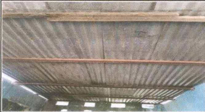
Foto 1: Techo de la cocina en mal estado, estructura deteriorada, lámina oxidada y picada.