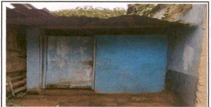
Foto 6: Baños unisex en estado de deterioro completamente, puertas de madera.

Observación: Si es necesario se pueden agregar hojas adicionales y actualizar el número de hojas.